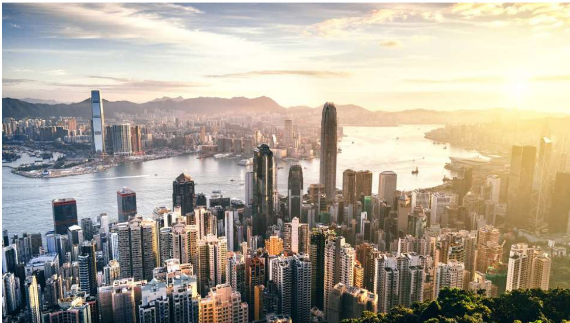
香港需要積極利用其獨特的地理和經濟優勢，應對全球經濟挑戰。