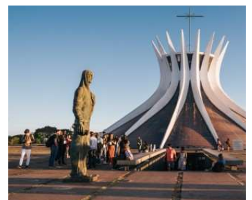
環球探訪 | 巴西和南非為香港帶遇 議事堂 | 4天前