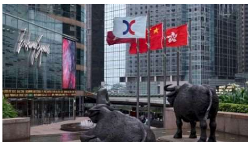
廖燦培 | 香港應發展為亞洲商品期貨中心 議事堂 | 3天前